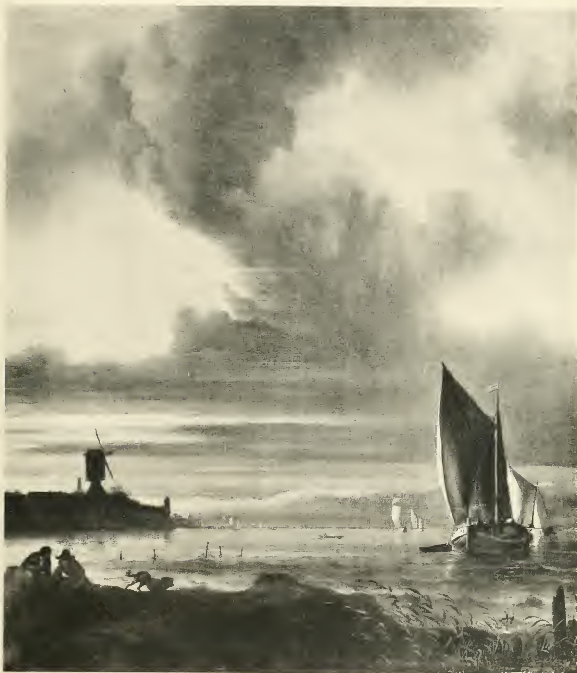
A. VAN DE VELDE

TERCENTENAIRE DE REMBRANDT - EXPOSITION FREDERIK MULLER & CIE.